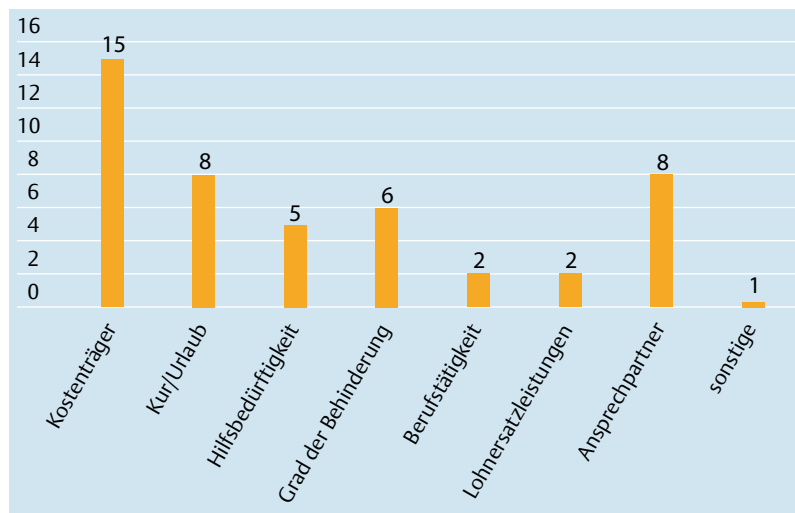
Abb. 2 Angehörigenwünsche im Bereich „Dialyse und Soziales“.