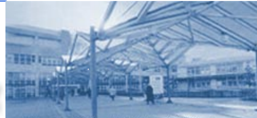
Standort Med. Klinik 4 Nürnberg

„Es tut mir leid, dass es so lange gedauert hat. Und wenn Sie noch am Leben sind, dann beantworte ich jetzt gerne Ihre Fragen.“